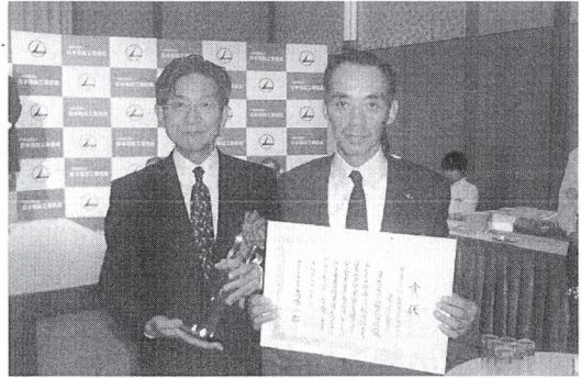
中小企業庁長官賞